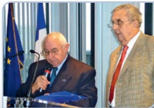
Lors de la cérémonie des challenges nationaux 2014.