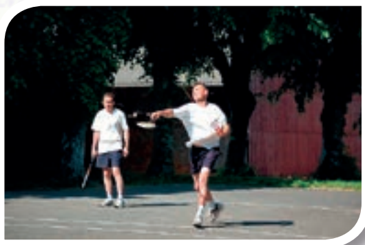
Joueur en action lors d'une partie en 2 contre 2.