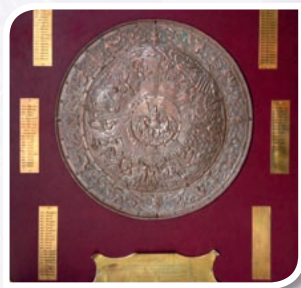
Le Bouclier de Brennus de la Fédération française de Longue Paume.

Il s'agit d'un bouclier rond finement ouvragé, monté sur un encadrement recouvert de peluche rouge... Par la suite la fédération française de rugby aura à nouveau l'occasion de reprendre contact avec Maître Raynal, avocat du sport, au sujet d'autres problèmes d'organisation interne.