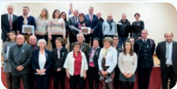
L'ensemble des récipiendaires ont été chaleureusement applaudis.