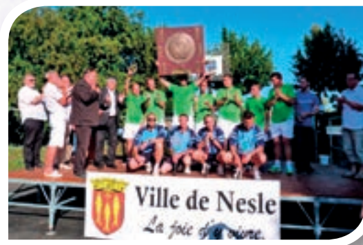
L'équipe de Nesle (Somme), championne de France de 2009 à 2013.