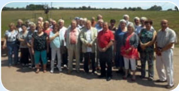
L'ensemble des participants à cette sortie bien conviviale.