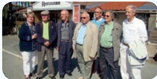
Jacques faisait également partie du Comité Régional de Nouvelle Aquitaine.

Un excellent buffet, offert par la DDCSPP, accompagné d'un verre de l'amitié de la commune de Saint-Jacques-de-Thouars ont ravi tous les participants et les échanges cordiaux ont clôturé cette soirée tout à fait réussie et appréciée des 110 participants.