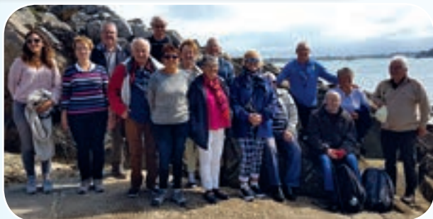
Les participants, après une journée de navigation, se sont montrés ravis de cette sortie.