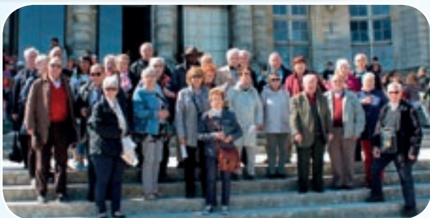
Face au château de Vaux le Vicomte, les participants ont pris la pose pour le photographe.